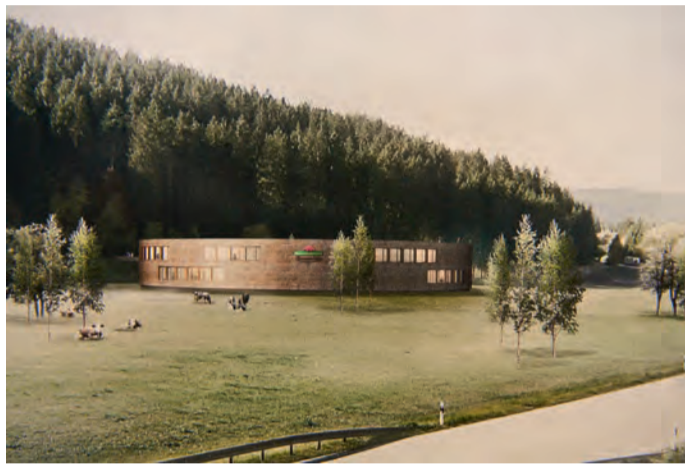
Der Gewinnerentwurf des Architektenwettbewerbs.

Titisee-Neustadt (dt.) In Titisee-Neustadt, nahe des Badeparadieses Schwarzwald sowie der Firma Testo soll die künftige Schwarzwaldmilch Käsemanufaktur entstehen. Geplant ist eine Schaukäserei mit einem Erlebnisrundgang, einem Verkaufsmarkt sowie einer angeschlossenen Gastronomie. Ausgeschrieben wurde der Gebäudeentwurf im Rahmen eines Architektenwettbewerbs.