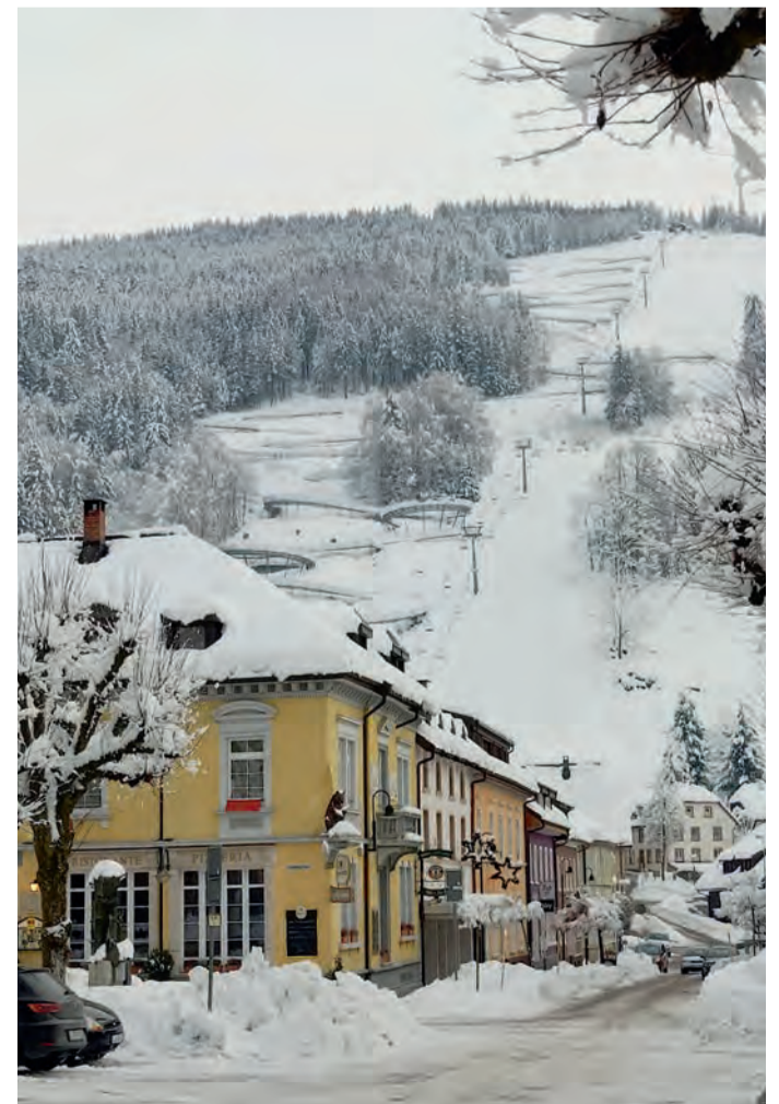
Blick vom Zentrum Todtnaus auf das Hasenhorn mit Hasenhornbahn