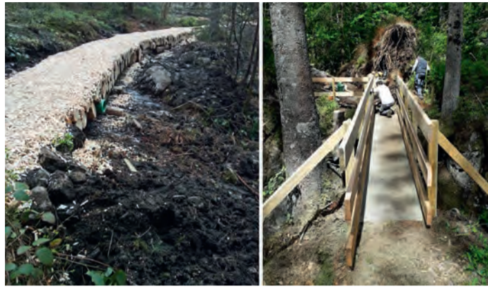
Viel zu tun haben die ehrenamtlichen Wegewart: So mussten am Schmelzplatz ein Bohlenweg erneuert und eine Brücke am Buselbachwasserfall instandgesetzt werden.