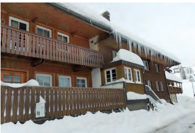
Das Salzhaus mit seiner Bergbaugeschichte – das älteste Haus in Muggenbrunn, einem Ortsteil Todtnaus

Dreisamtäler: Herr Wießner, vielen Dank für das Gespräch! Das Gespräch führte Dagmar Engesser, coronabedingt auf digitalem Weg